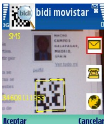
Irudia 4: Movistarren bidi kode bat eta honek ahalbidetzen dituen ekintzak

Esan bezala badaude hala ere hainbat formatu estandar irekietan oinarritua antzeko kodeak irakurtzeko aukera ematen dutenak. Kode hauek Datamatrix eta QR kodeak dira. Hauei buruzko informazioa hemen topatu daiteke: