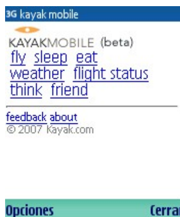
Irudia 1: kayak.com bertsio mugikorraren hasiera orria

Bidai bilaketak egiteko garaiak hasiera eta bukaera aireportuen kodeak sartuz bakarrik hurrengo ordutan ateratzen diren hegazkinen datuak emateko gai da eta hauekin batera kontakturako behar diren datu guztiak.