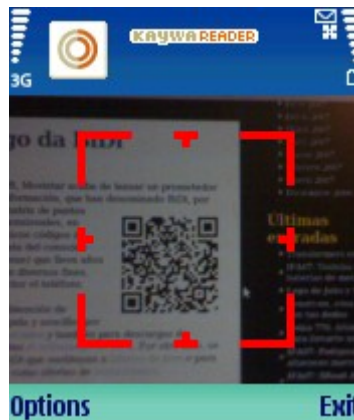
Irudia 7: Kayak.com-eko irakurgailua erabiliz kode bat jasotzeko