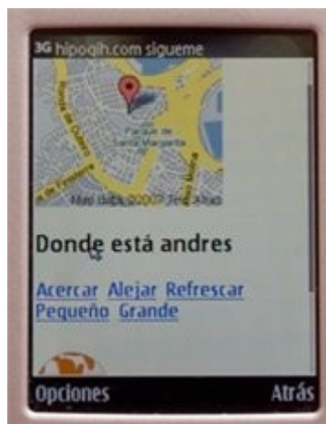
Irudia 8: hipoqih.com mugikorreko aplikazioa martxan

http://www.hipoqih.com guneak adibidez GPSdun telefono mugikorrek bidalitako testuinguru informazioa erabiliz sare sozial bat sortzeko aukera ematen du. Nahi diozunari (eta zuk aukeratuz) zure lagunei non zauden esateko aukera duzu, horretarako jaisteko aplikazio bat eskaintzen dutelaik.