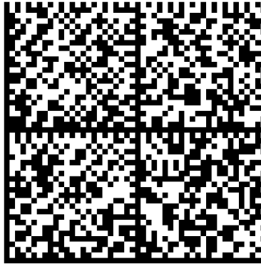
Irudia 6: Datamatrix kode sortzailea erabiliz adibide bat