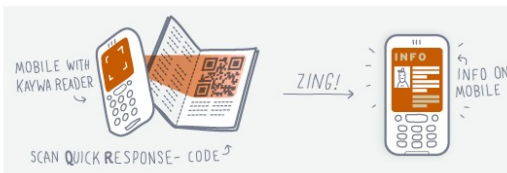
Irudia 5: Irakurgailuaren funtzionamendua erakusten duen grafikoa

Era berean, hauek sortzeko eta irakurtzeko dohaineko tresnak ere badaude, http://www.kaywa.com enpresak adibidez kode hauen sorkuntza albidetzen duten tresnak eta hauen irakurketa ahalbidetzen duten aplikazioak dohainik eskaintzen dituzte.