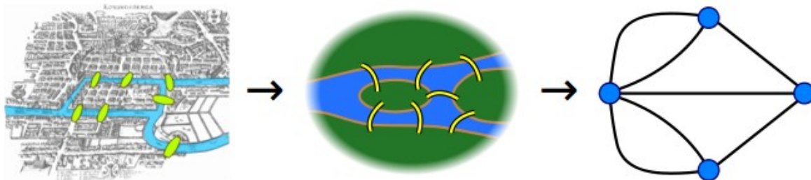
Könisberg-eko zazpi zubiak eta Eulerren teorema

Sare sozialak, normalean, grafoen bidez adierazten dira. Nodoak pertsonak dira eta horien arteko harremanak, aldiz, ertzak. Era horretan pertsona multzo batek dituen harreman mota ezberdinak adieraz ditzakegu. XVIII. mendean Könisberg-en (Kaliningrado) Eulerrek gauza garrantzitsu bat erakutsi zion munduari. Könisberg-etik Pregel ibaia igarotzen da eta horrek irla antzeko batzuk sortzen zituen. Irla horiek zubien bidez lotzen ziren alde ezberdinetara. Herrian bazegoen joko antzeko bat, esaten zuena ezinezkoa zela zubi horiek igarotzea, baten batetik bi aldiz pasatu gabe. Hori frogatzeko Eulerrek grafo teoria erabili zuen, irlak nodo bezala jarriz eta zubiak harreman bezala markatuz.